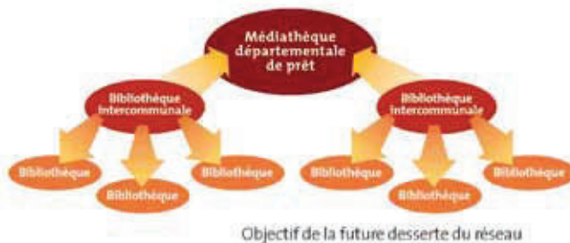
▲ Schéma de la desserte du réseau de la MDP présenté dans le Haute - Saône Magazine – automne hiver 2008.

Le développement des échanges sur place à la MDP et la réorganisation de l'amplitude des passages a abouti à la réforme de deux bibliobus à la fin de l'année 2011.